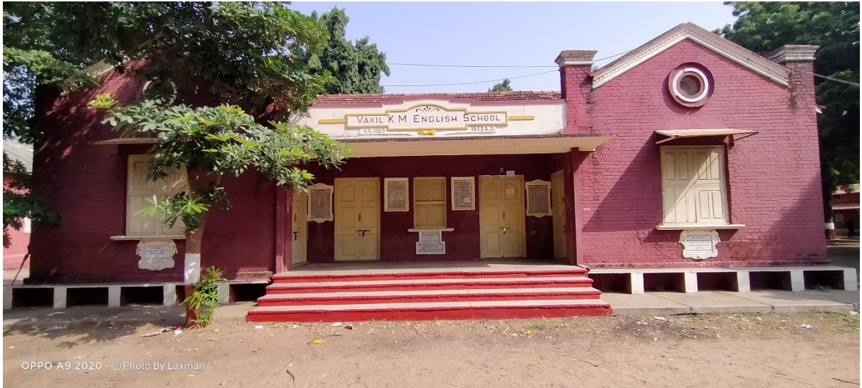
VAKIL K M ENGLISH SCHOOL