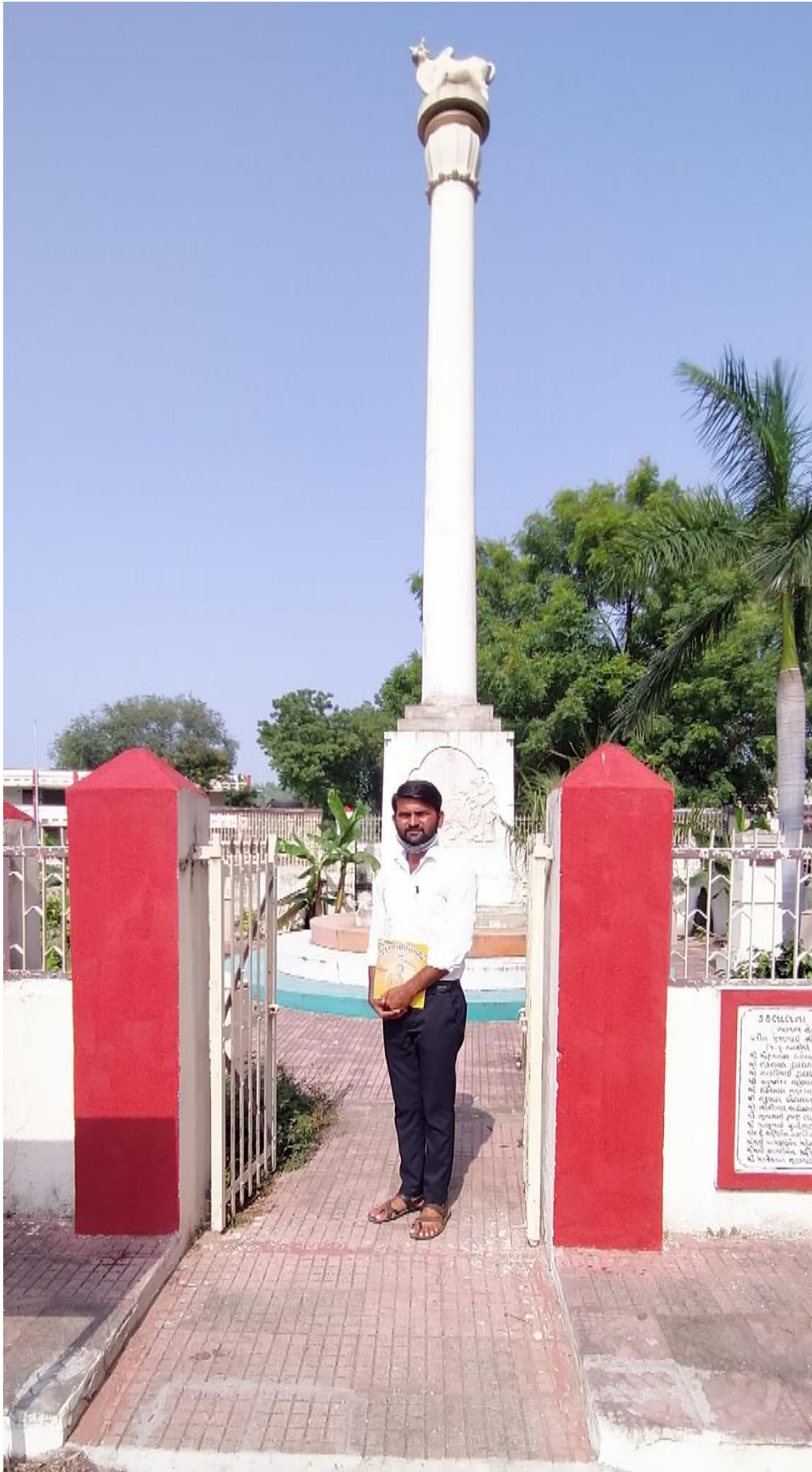
ખેડા સત્યાગ્રહ સ્મારક (કીર્તિસ્તંભ)